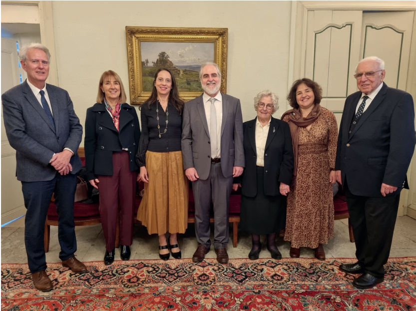
Achévé d'imprimer sur les presses de l'imprimerie MONDIAL Livre à Nîmes Dépôt légal mars 2026